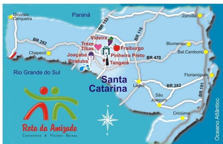
Figura 3 - Vias de Acesso à Rota da Amizade

O Aeroporto de Joaçaba 21 , localizado às margens da BR-282 e distante 6 km do centro da cidade, opera apenas com vôos da empresa regional NHT Linhas Aéreas.