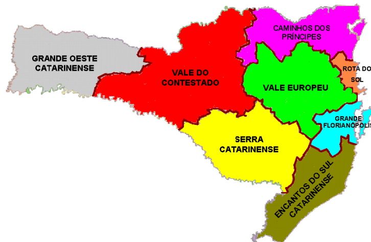
Figura 2 - Regiões Turísticas de Santa Catarina

O território onde encontra-se o APL-RA, denomina-se região turística “Vale do Contestado”, e está localizado geograficamente no Meio-Oeste de Santa Catarina conforme mostra a figura 2. Nesse território está inserido o roteiro turístico integrado, conhecido por Rota da Amizade, que atende ao Programa de Regionalização do Turismo do Mtur. O gerenciamento do APL-RA cabe ao Rota da Amizade Convention & Visitors Bureau , instituição que reúne as empresas dos municípios que formam esse roteiro turístico.